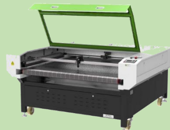
LC II -1390 固定ベッドレーザー自動裁断機