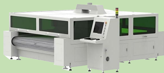
LC II 2125F コンベアベッドレーザー自動裁断機